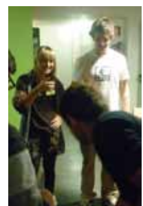
Cena de navidad FVJE.