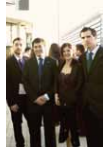
VII Congreso Interanual de Castellón.