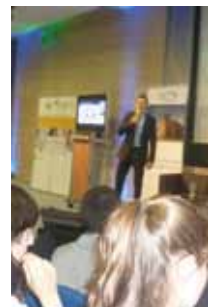
Summer Jade Meeting en Vienna.