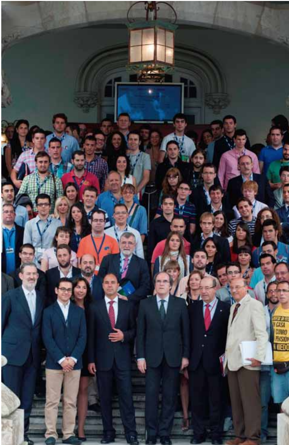
Últimas jornadas del CREU en Santander con el ministro de Educación.

A continuación se muestran los eventos más importantes en los que se ha estado representando.