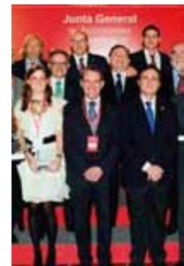
III Edición del premio nacional Uni-proyecta.